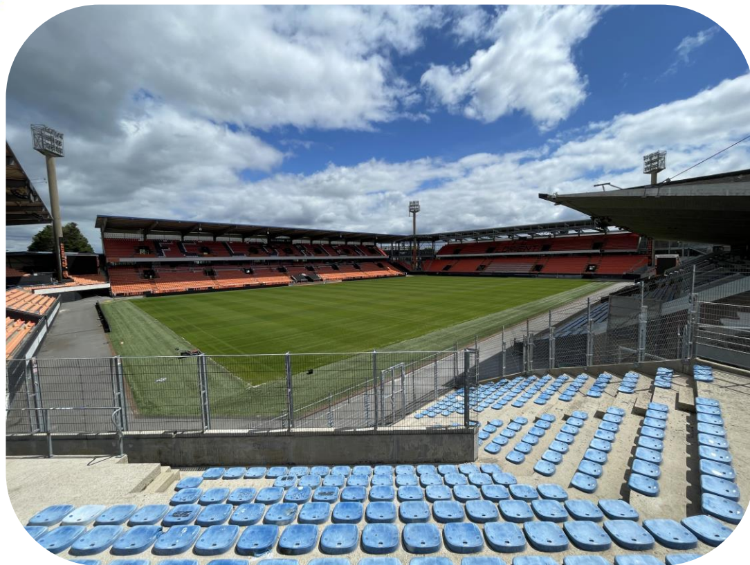
Vu de la tribune