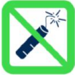
Articles pyrotechniques et matériels explosifs Pyrotechnics and explosive materials