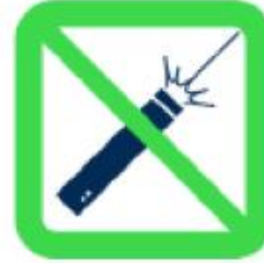
Pointeurs laser Laser Pointers