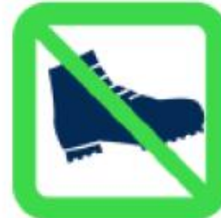
Chaussures de sécurité Safety Footwears