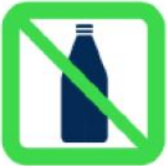
Bouteilles - Contenants à bouchon - Verres - Canettes Bottles - Cork containers - Glasses - Cans