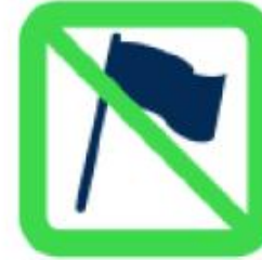
Hampes rigides, fagots de drapeaux Flagpoles